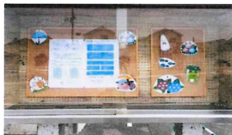
6月仕様に変更しましたよ♪