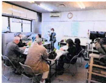
じっくり丁寧に解説中！

講師の先生も昨年と同じ方だったので、説明も慣れた様子で会員の皆さんと和気あいあいと楽しいスマホ教室にさせていただきました！