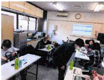
一人一人確認して回る先生