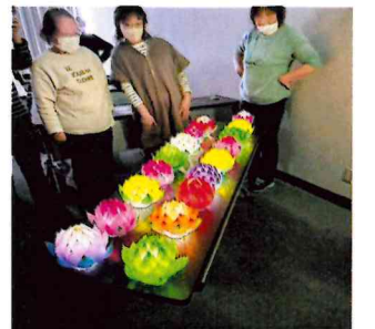
完成された 「蓮の花ランタン」

さらに、近年いたるところで大規模な災害が発生し、いつ何が起こるかわからない時代に備える為、蛇田公民館で「防災に備えるセミナー」を開催しました。東日本大震災の記憶が薄れつつある今日(こんにち)、今一度防災意識を高め、確認できたと思います。