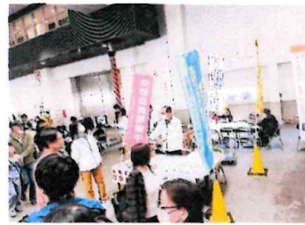
シルバー人材センターのブースに多くの人を訪れた

用意した1,000個はあっという間に無くなり、「大漁まつり」の盛り上がりで圧倒されました。