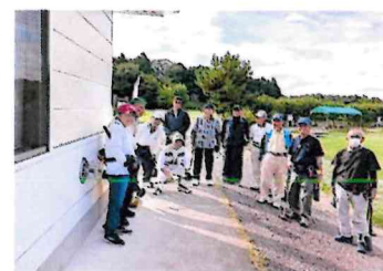
優勝目指してがんばるぞ～！