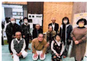
筆耕班展示物とともに記念写真

★令和6年11月7日「健康感謝のつどい」に参加皆様、お気軽に筆耕練習会へご参加下さい。