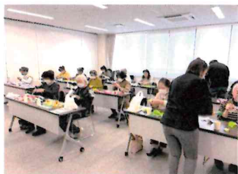
もくもくと作製中

来年度も様々な講習会を開催する予定なので、案内が届いた際は是非目を通し、参加お待ちしております。