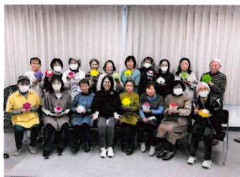
先生と一緒にハイ・チーズ！