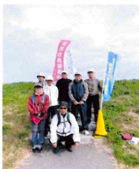
みんなで歩いてハイ・ポーズ

今年度「お散歩クラブ」の行事は、昨年10月26日(土)石巻市の中心部を流れる「北上川」の堤防を「石井閘門」から「水押」「水明町」を経由して「みやぎ生協石巻大橋店駐車場」まで、休憩を挟みながら、片道約1時間30分のコースでした。10時に「石井閘門」の駐車場を出発し「みやぎ生協石巻大橋店駐車場」に着いたのは、11時50分でした。