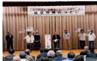
サークル活動発表